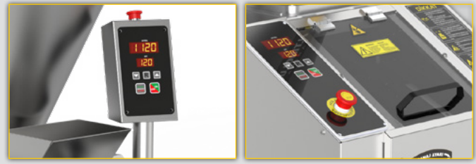
Direkli ve Makine üzeri kontrol seçenekleri

A Volumetric Dough Divider is a critical device in dough product manufacturing. This machine offers the ability to cut dough to the desired weight without compressing or causing damage. To ensure product safety and hygiene, all surfaces that come into contact with the dough are made of stainless steel. This provides a healthy and hygienic production environment.